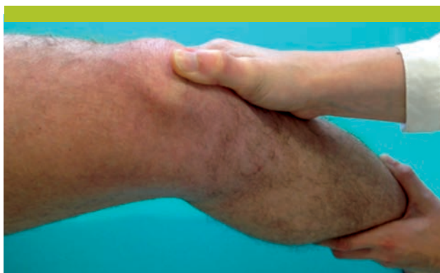
Figure 2. «Le signe du rabot»

Illustration de la mobilité patellaire médiale du genou droit. La patella est saisie en position de repos (A), puis déplacée médialement (B). L'amplitude du déplacement est évaluée en fonction de la largeur de la patella, divisée en quatre quadrants de même largeur (C). Le déplacement de moins d'un quadrant indique une raideur latérale, et de plus de trois quadrants une hypermobilité.