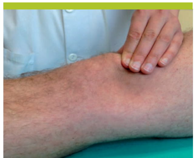
Figure 4. Test de Zholen ou ascension contrariée de la patella

Ce test évalue la raideur des structures latérales. La patella est saisie entre le pouce et l'index avec le genou en extension. La partie médiale est alors compressée et la partie latérale élevée. Le test est positif si la partie latérale de la patella ne peut s'élever et reste en position horizontale.